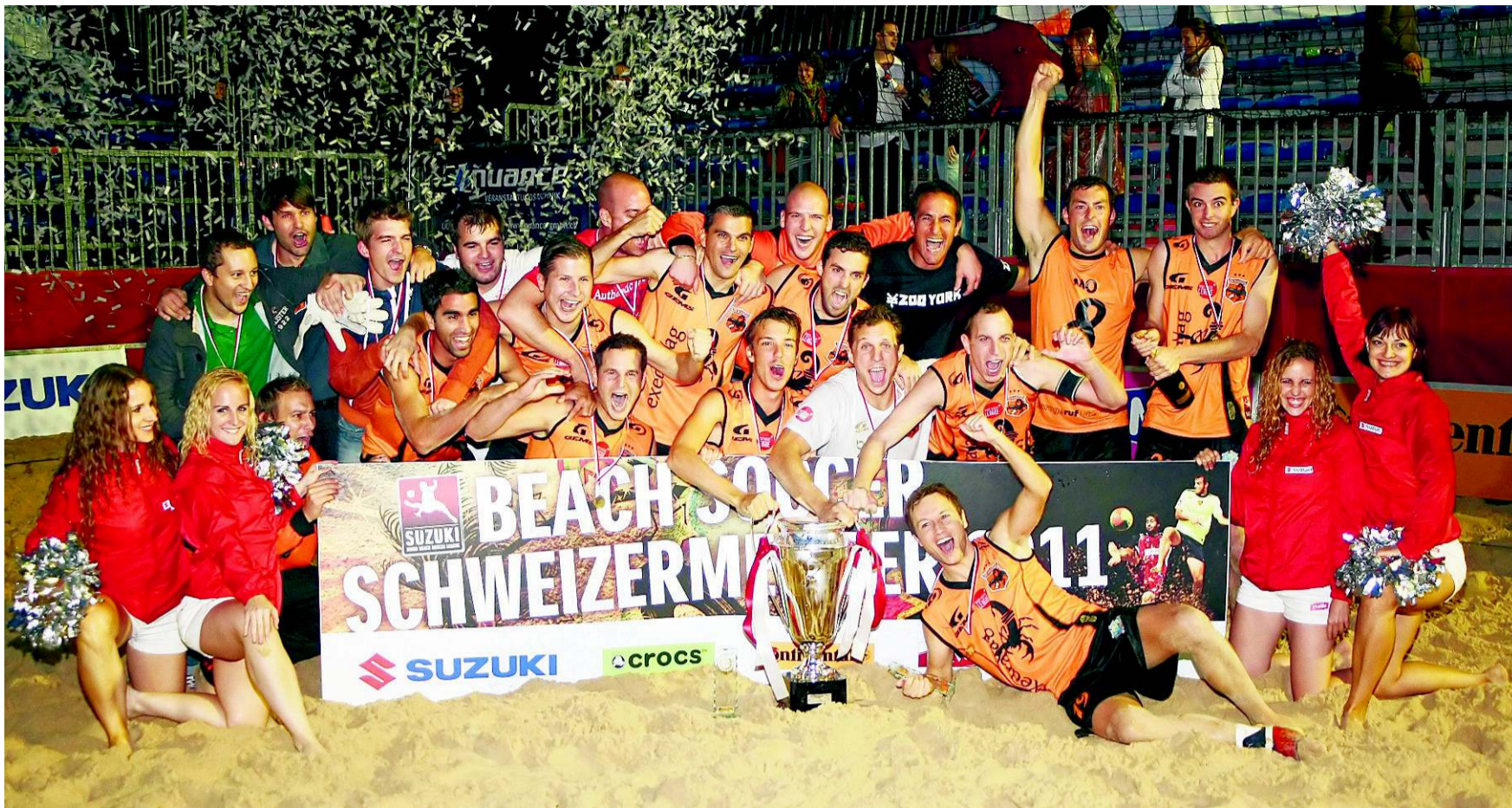
So sehen Sieger aus: Die Basel Scorpions feiern den zweiten Schweizer-Meister-Titel in Folge.