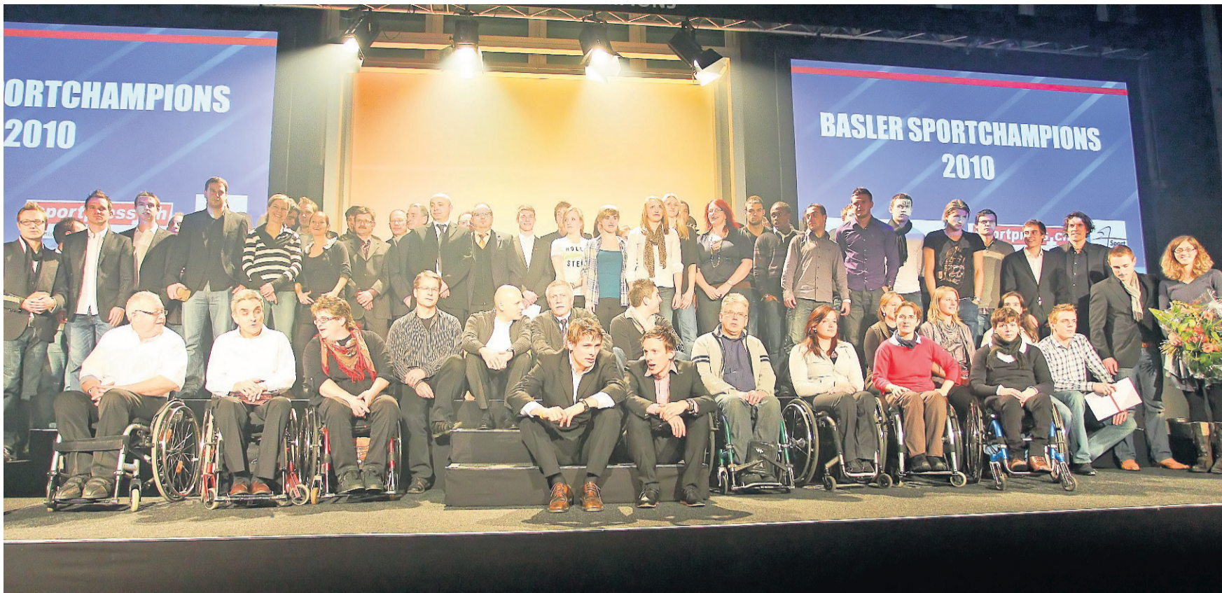
Gewinner, so weit das Auge reicht: Am Ende durften alle Basler Sportpreisträger noch einmal ins verdiente Rampenlicht. SACHA GROSSENBACHER